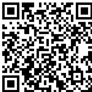
友だち追加用QRコード

スマートフォンでLINEの「友だち追加」→「QRコード」を開き、こちらのQRコードを読み取ってください。